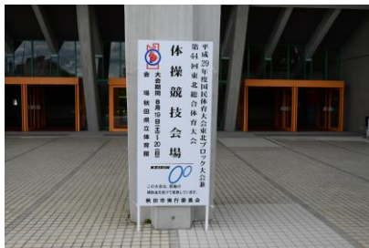
国民体育大会ブロック大会 競技会場の表示

全国9ブロックで実施した国民体育大会ブロック大会に対し、開催費の一部を助成した(参加者45,026名)。