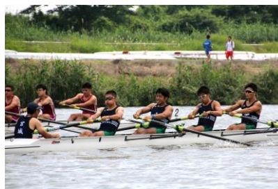
国民体育大会ブロック大会 ボート競技の様子